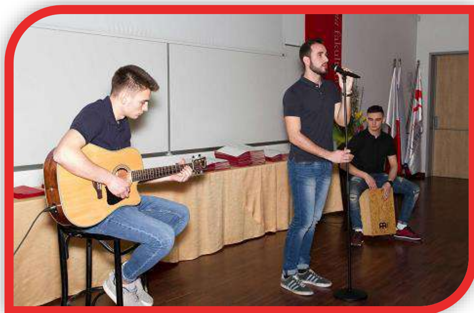
Slika 11: Glasbeni program na Dnevu Zdravstvene fakultete