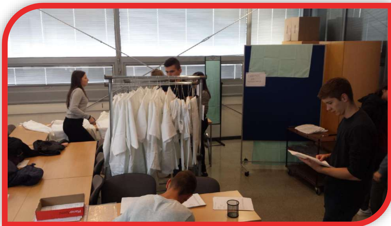
Slika 5: Pomerjanje uniform na fakulteti

Pripravili: Manja Šmigič, Tinkara Odar, Pia Pirnat (Babištvo)