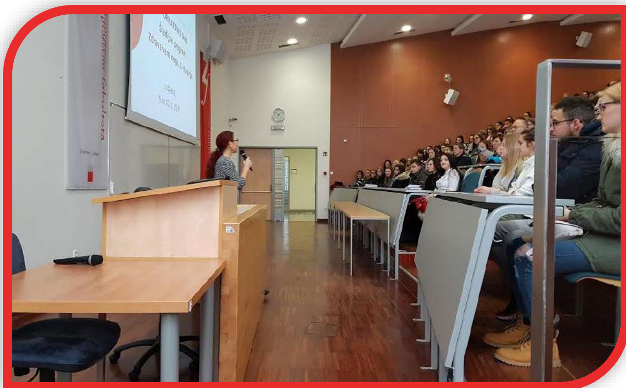
Slika 9: Nagovor ob predstavitvi študijske smeri Zdravstvena nega