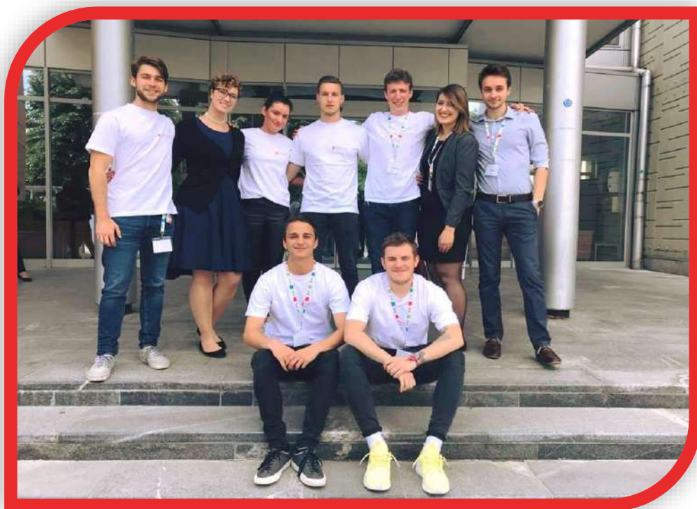
Slika 13: Tutorji ter predstavniki Študentskega sveta - Mednarodna študentska konferenca

Pripravili: Anja Vode, Nuša Zagoričnik, Saša Šajn Lekše (Zdravstvena nega)