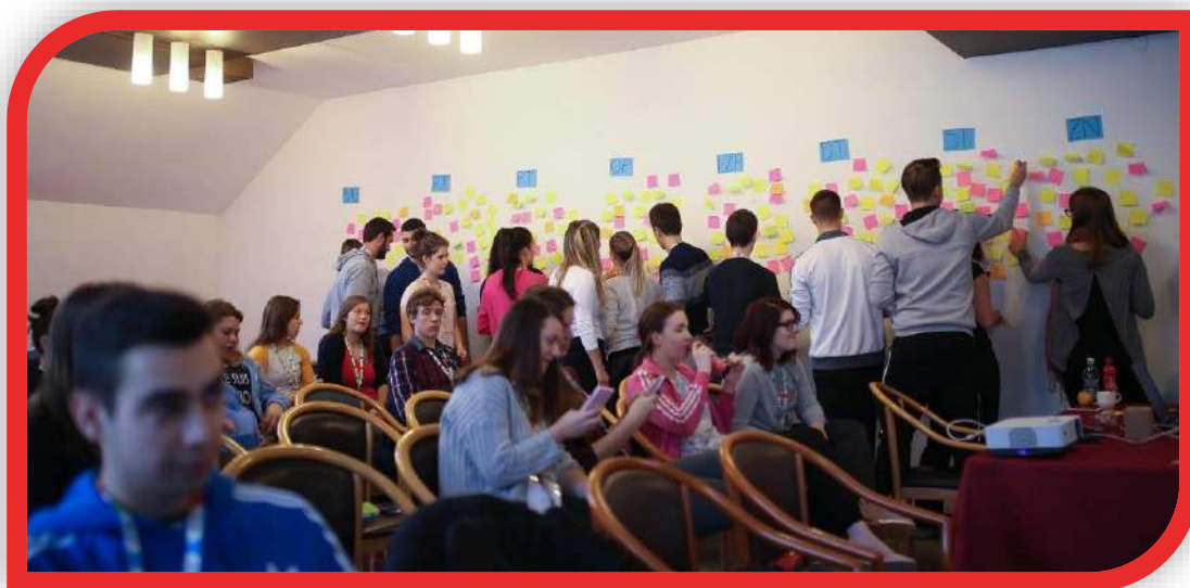
Slika 6: Druženje na Zdravstvenem vikendu