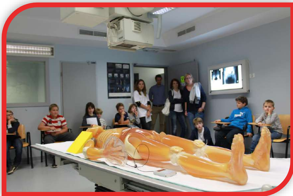
Slika 3: Tutorji (v ozadju) na Noči raziskovalcev 2017

Pripravili: Anja Vode, Nuša Zagoričnik, Saša Šajn Lekše (Zdravstvena nega)