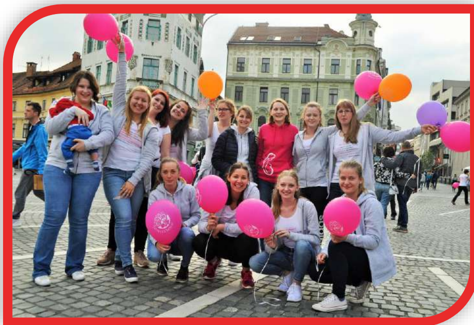
Slika 12: Utrinek iz Babiškega tedna - Prešernov trg