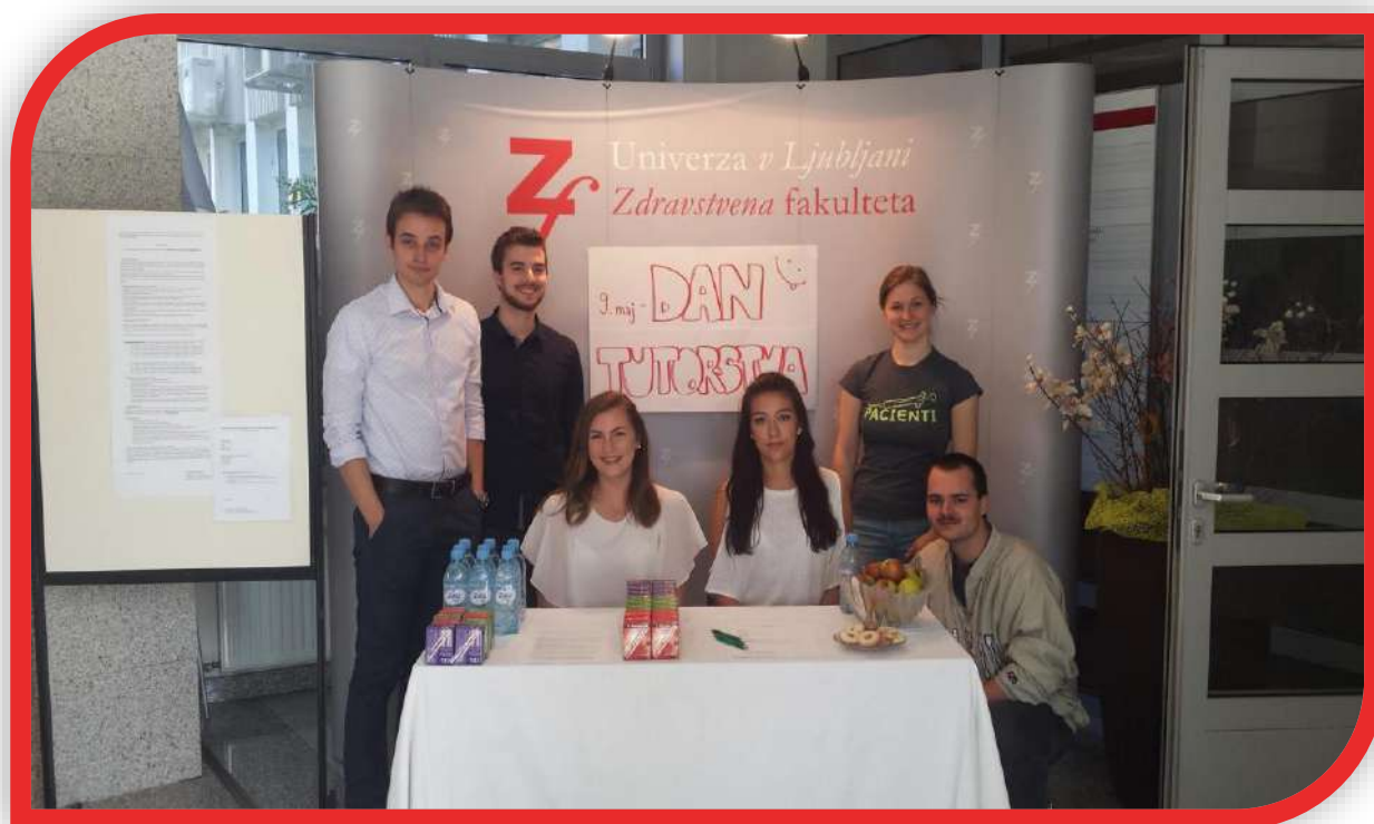
Slika 14: Tutorji študentje na Dnevu tutorstva ZF